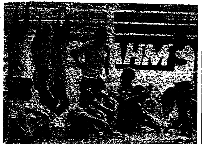
لاعبون برازيليون يستمعون الى مديهم لازاروتشي عشية مبارياتهم والرجنتين